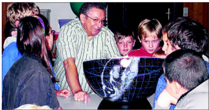
Astronomen vermitteln mit Modellen anschaulich ihr Wissen ...

Die Astronomie ist das verbindende Element zwischen Mathematik, Physik, Informatik, Raumfahrt sowie Geografie und Geschichtsunterricht. Diese Erkenntnis wollen wir an die Schulen herantragen.