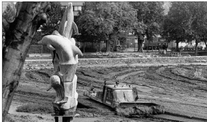
Ein umgebauter Pistenbully hat im September 1994 ganze 16 000 Kubikmeter Schlamm aus dem Oberen See in Böblingen geholt

So weit soll es nun nicht kommen. Baubürgermeister Johannes Mescher konnte Befürchtungen entgegenreten, die Entschlammung werde ein Fass ohne Boden. Sein Vorschlag, der eine Mehrheit fand: In